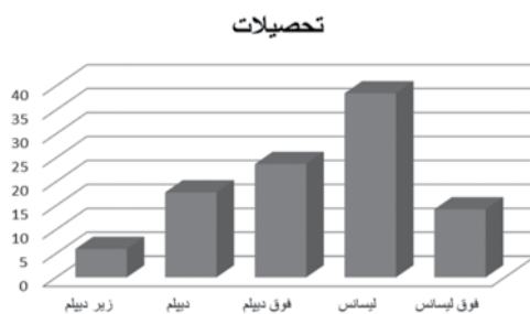
شکل ۳: نمودار ستونی درصد فراوانی پاسخ دهندگان بر حسب تحصیلات

موثر بر انتخاب تأمین کنندگان کالا و خدمات در «کارخانه نساجی خزر ریس لفور» می باشد.